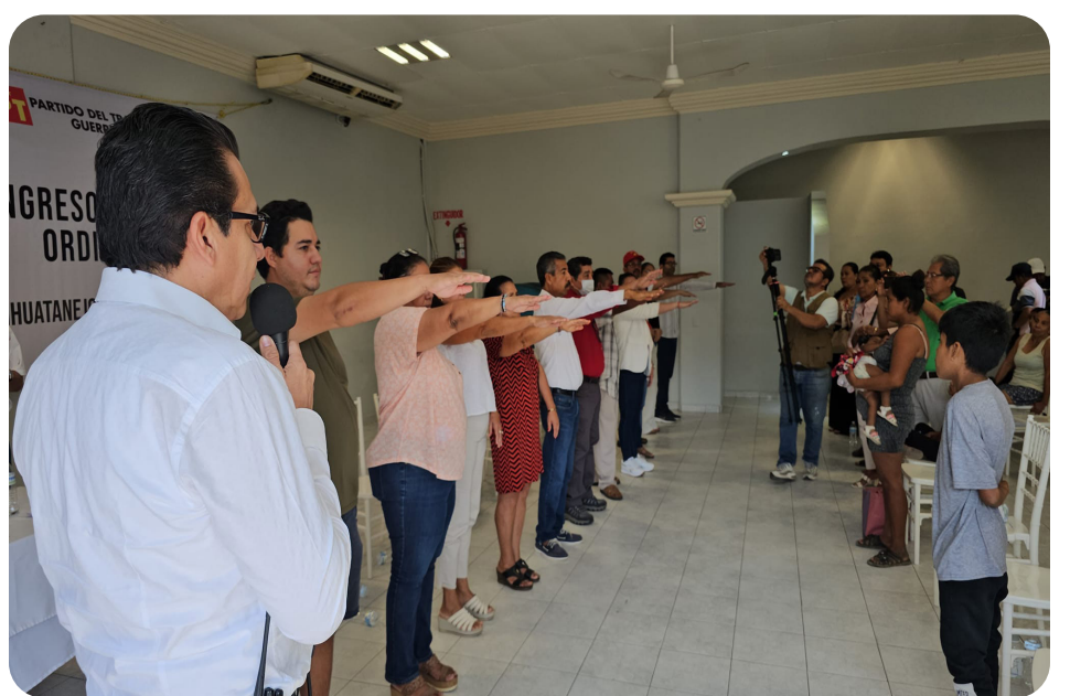
Muy agradecido con nuestros compañeros del Municipio de Zihuatanejo de Azueta, Gro. Reunión de restructuración municipal.