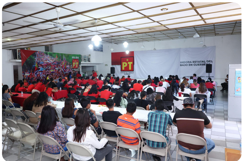
Reunión y capacitación de Jóvenes del PT Gro.