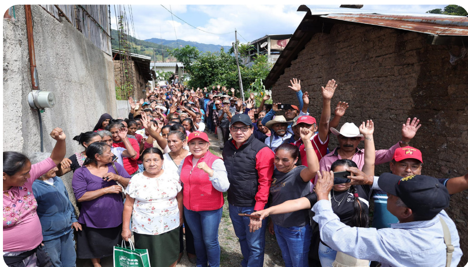
Visitamos comunidades del Municipio de Iliatenco, Gro. Y el Municipio de Tlacoapa, Gro. Un gusto poder servir a nuestros pueblos en estos momentos de necesidad por las afectaciones del huracán John.