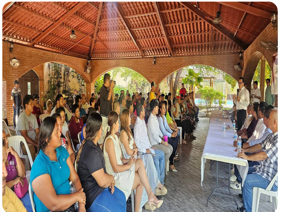
Reunión de Trabajo con la Militancia petista del Municipio de Benito Juárez Guerrero, (San Jerónimo), Costa Grande.