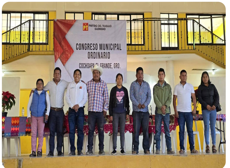
COCHOAPA EL GRANDE, GRO.