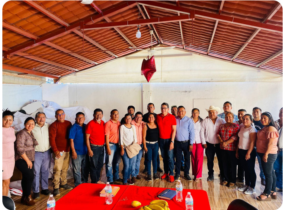
Reunión de organización con los compañeros Coordinadores de la Región de la Montaña.