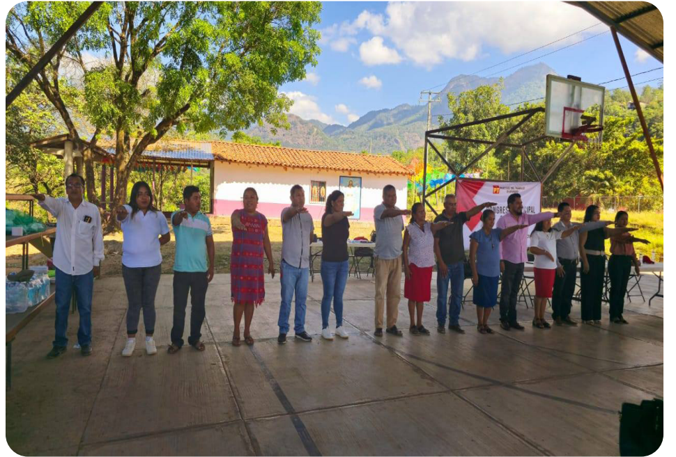
SANTA CRUZ DEL RINCÓN, GRO.