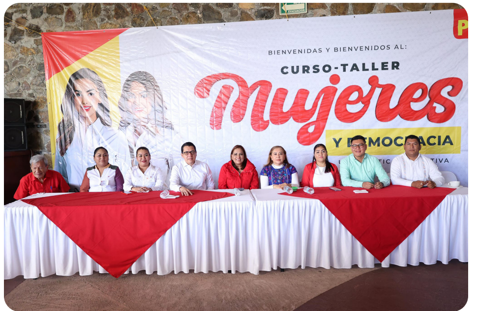
Con éxito se desarrolló capacitación para compañeras Mujeres en la Capital de estado, Chilpo de los Bravo, Gro.