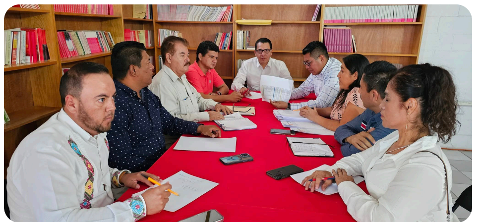
Excelente reunión de Trabajo con los Coordinadores de Región Centro, Región Norte, Región Tierra Caliente, Región Costa Grande y Región Costa Chica, para la reorganización de las estructuras partidistas.