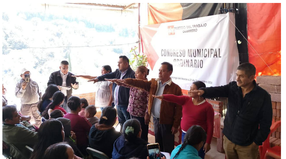
ATLAMAJALCINGO DEL MONTE, GRO.