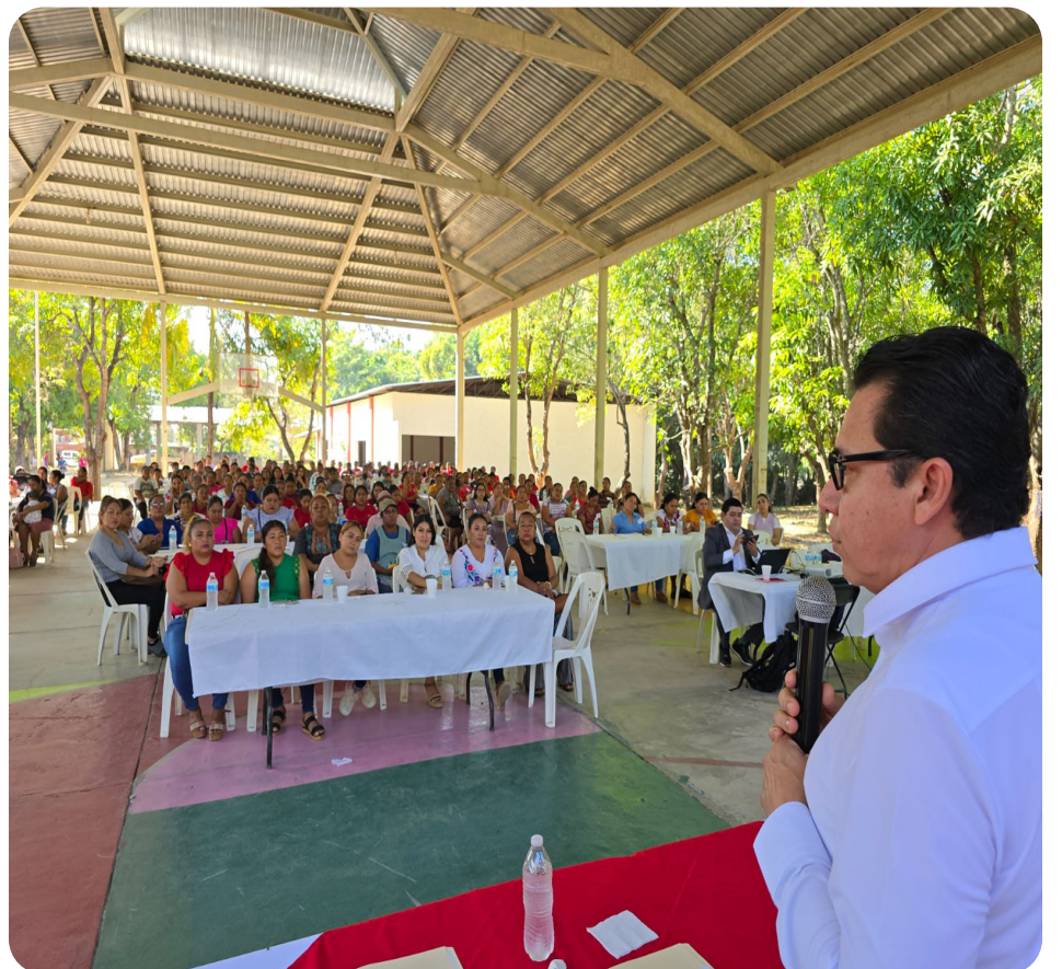
Capacitación en Prevención y Atención a la Violencia Política contra las mujeres en la Región Costa Chica de Guerrero, Sede San Luis Acatlán.