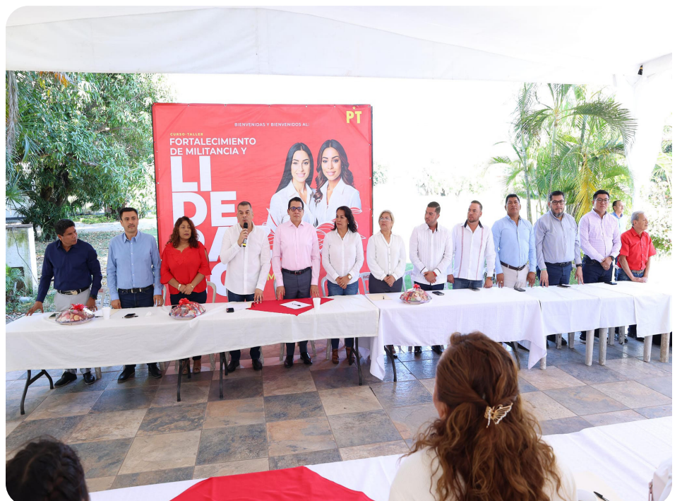
Capacitación de Mujeres Petistas del Municipio de Iguala de la Independencia, Gro.